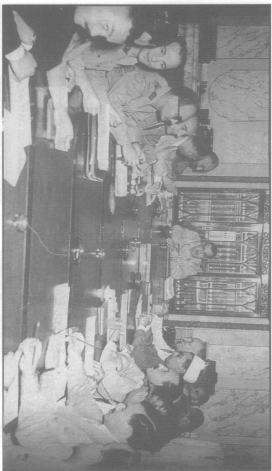
اجتماع مجلس الوزراء برئاسة جمال عبد الناصر